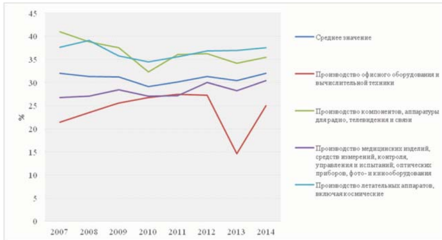
Рис. 1. Уровень инновационной активности организаций высокотехнологичных отраслей