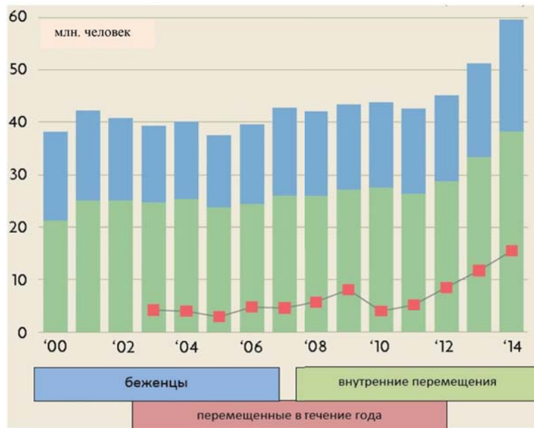
Рис. 1. Перемещения в XXI веке, млн. человек [1]

Именно страны Западной и Северной Европы являются целью беженцев: там они хотят остаться жить и работать и туда они будут стремиться до тех пор, пока ЕС будет их принимать. Не пускать их – значит обресть на страдания и смерть. Их можно понять. Впускать всех подряд – обресть самих себя на вымирание в перспективе. Но можно понять и рядовых европейцев, которым такое нашествие абсолютно чуждых в языковом, культурном, религиозном отношении людей совершенно не по душе. Что же происходит?