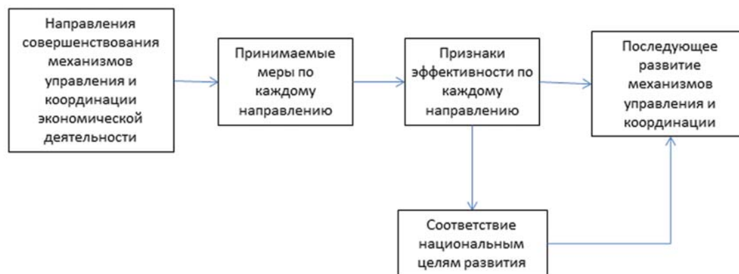
Рис. 3. Порядок настройки модели национальной экономики РФ

развития. При этом важно сформировать перечень мер, принимаемых по каждому направлению развитию. Такой перечень мер следует определять на основе сценариев развития, предполагающих построение взаимосвязанной совокупности мер, ориентированных на социально-экономическое развитие. Формирование таких сценариев следует проводить с учетом перспектив технологической модернизации экономики России, значительно уступающей в настоящее время мировому уровню [4].