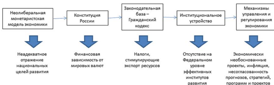
Рис. 1. Схема взаимосвязей законодательной и институциональной поддержки неолиберальной модели экономики России

В этот период отчетливо проявились недостатки неолиберальной модели экономики, которая в большей степени подходит для стационарной рыночной экономики, а ее основы были заложены ранее и нашли свое отражение в конституции России, Законодательной базе, в составе сформированных институтов, обслуживающих экономические и социальные процессы, а также в механизмах управления и регулирования экономики (рис. 1). Поэтому переход к другой модели экономики и даже ее корректировка сопряжены со значительными трудностями и масштабными реформами.