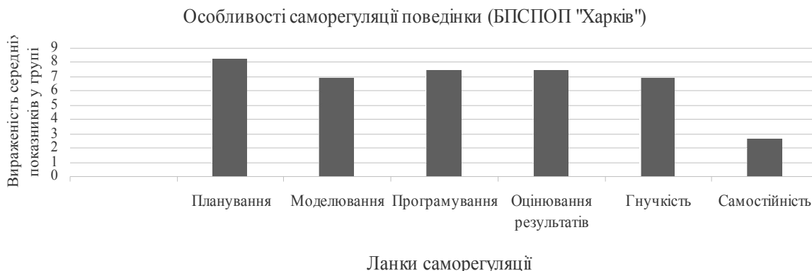
Рис. 1. Вираженість ланок саморегуляції поведінки співробітників підрозділу Національної поліції БПСПОП «Харків»

У дослідженні була виявлена статистично значуща відмінність за показником загального рівня саморегуляції: він виявився вищим у групі підрозділу Національної поліції БПСПОП «Харків» (36,96 балів; p=0,013^* ; p\leq 0,05 ). Така розбіжність насамперед пов'язується з тим, що середній вік та стаж роботи у правоохоронних органах України був вищим саме в підрозділі БПСПОП «Харків», а, як відомо, досвід та належна підготовка відіграють значну роль як у рівні саморегуляції особи, так, відповідно, й у рівні її адаптації до нетипових умов.