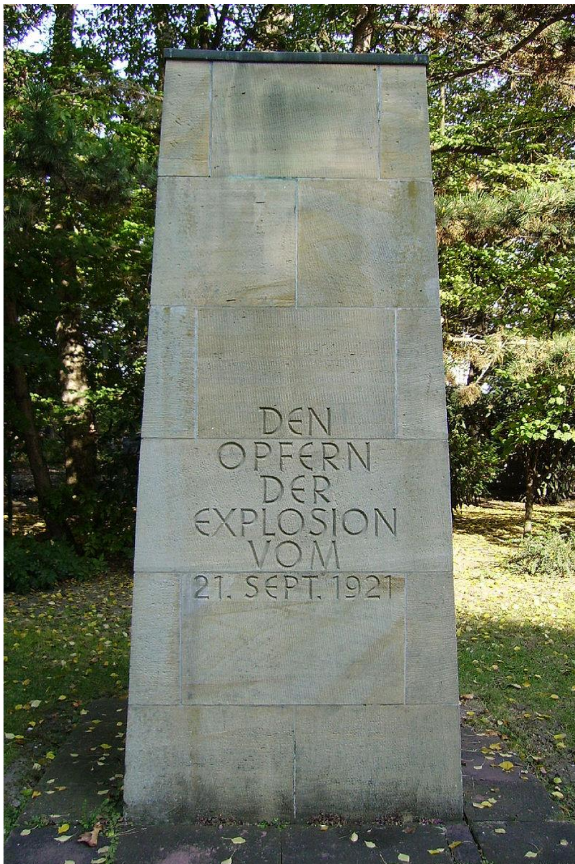
Рис. 3. Памятник жертвам взрыва 1921 г.