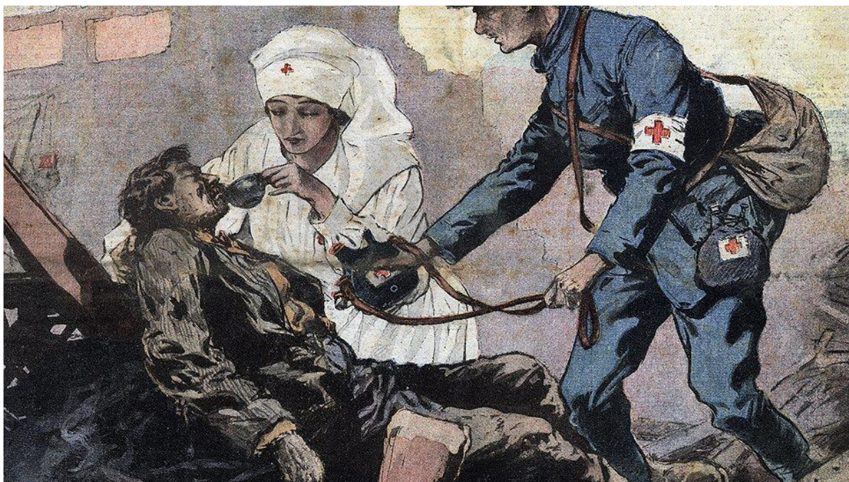
Рис. 2. Спасательные работы в городе Оппау

По официальным данным был убит 561 человек и свыше полутора тысяч получили ранения и ожоги. Однако эти цифры совершенно не вяжутся с апокалипсической картиной катастрофы, превратившей несколько десятков квадратных километров густозаселенного района в лунный пейзаж, и потому уже само по себе вызывает глубокое недоверие к той сводке потерь, которую представили прессе руководство компании и муниципальные власти. Которые предприняли просто «героические» усилия по уходу от ответственности за халатность, ибо полностью отсутствовал контроль за проведением столь опасных работ, притом в густонаселенной местности. По слухам жертвами взрыва стали более 4000 человек [2, 6].