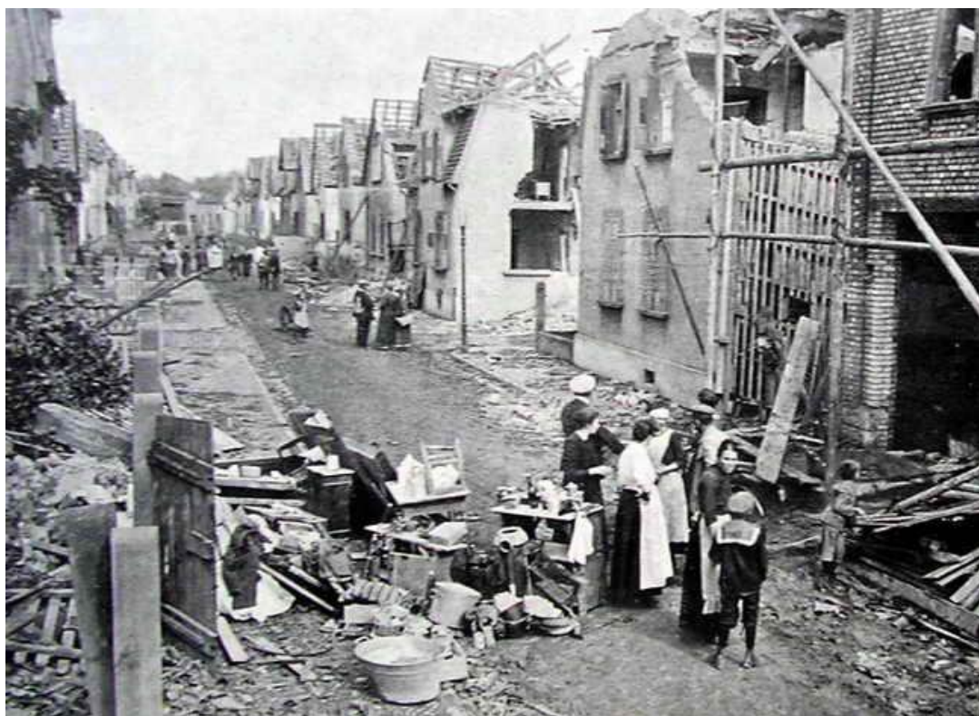
Рис. 1. Улица города Оппау после взрыва

несколько шашек. В отличие от пороха действие этого вещества бризантное, что привело к детонации и мгновенному взрыву всей масса аммония. Взорвалось около 12 тысяч тонн, энергия взрыва оценивалась специалистами в 4-5 килотонн тротилового эквивалента. Почему подрядчик принял такое решение, установить не удалось, ибо исполнителей в ходе инцидента разнесло даже не на клочки, а на атомы, так что спросить было, как бы не у кого и не с кого. Хотя понятно, что главным стимулом бизнесмена было желание сэкономить, проще говоря, обычная жадность [5].