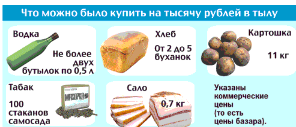
Рис. 2. Что можно было купить на 1000 руб. в годы войны (рыночные цены)

Цены на рынке в годы войны выросли в 13 раз против довоенных. Бутылка водки стала стоить 400 – 800 рублей. Буханка хлеба стоила от 200 до 500 руб., картошка – 90 руб. за кг, сало – 1500 руб. за кг, самосад – 10 руб. стакан (см. рис. 2).