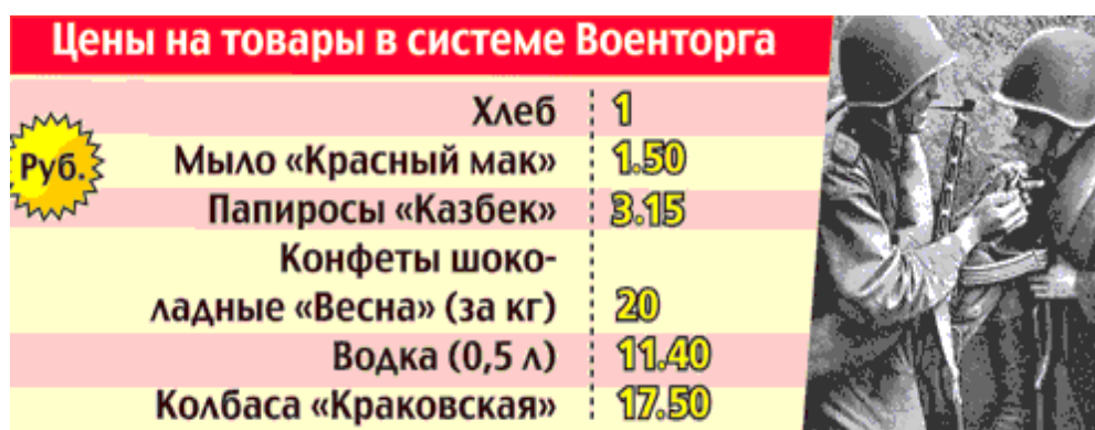
Рис. 3. Цены на товары в системе военной торговли

В конце декабря 1944 года для воинов Красной Армии была предоставлена возможность отправить посылку в тыл страны.