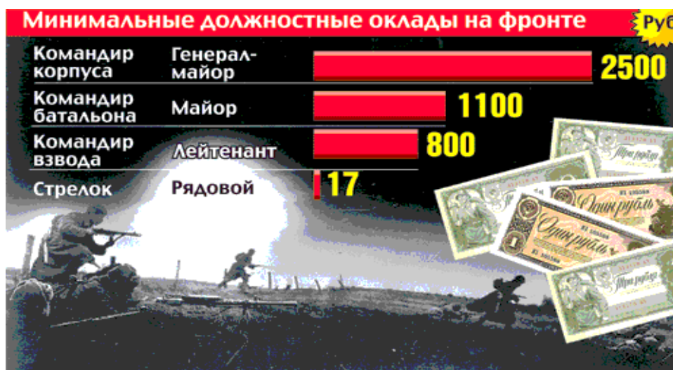
Рис. 1. Должностные оклады Красной Армии в годы Великой Отечественной войны

«добровольное» участие в госзаиме на нужды обороны страны. Так, рядовой-стрелок получал 17 рублей, командир взвода (офицер) – 620-800 рублей, командир роты – 950 рублей, командир батальона – 1100 рублей, командир корпуса – 2500 рублей [10] (см. рис. 1).