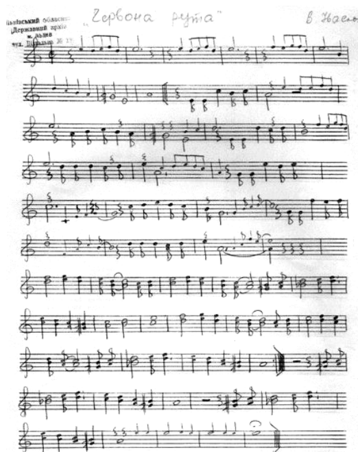
Рис. 3. Автограф музичного тексту пісні «Червона рута» (Державний архів Львівської області)

Робочі матеріали пісні «Червона рута» збереглися в Державному архіві Львівської області [16]. У пісні характеристикою кохання є його прив'язаність до лексико-семантичної групи, яка, з однієї сторони, висловлює тонкі особистісні почуття світлої печалі, мрій і сподівань , а з іншої – змальовує карпатську природу та має відгомін прадавніх народних ворожінь і вірувань у чарівну силу любові.