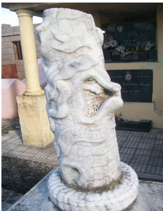
Figuras 4 - Monumento do tipo Obelisco no Cemitério da Irmandade da Santa Casa de Caridade de São Gabriel, São Gabriel, RS

Este monumento foi transportado para a Praça interna da Irmandade da Santa Casa de Caridade de São Gabriel para sua preservação sendo que no Cemitério estava sendo depredado, porém hoje se encontra novamente no Cemitério, conforme Figura 4.