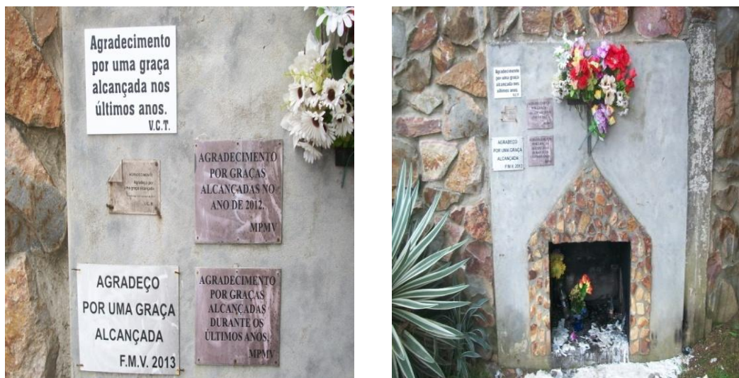
Figuras 8 - A Capela dos “Noivinhos” na Rua Antônio Trilha, São Gabriel/RS e placas no local em agradecimento a graças alcançadas..