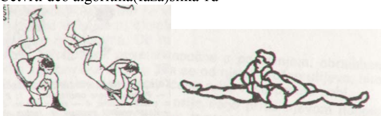
Četvrti deo algoritma(faza)slika 1d