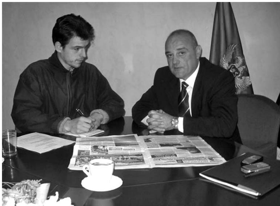
Mediji su dali veliki doprinos uspjehu Kongresa CSA

This way of managing sports club has proved to be a very good combination of the two kinds of capital and their participation in financing of the club, and it is recommended as a successful model of the structure of sports clubs management, especially at lower level of competitions.