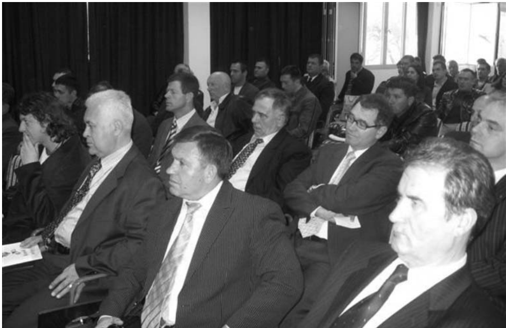
Na Kongresu je bilo mnogo interesantnih tema

From sports activities to sports service, development and actualization of sport goes through particular forms of organization. Those are sports events, sports divisions, individual departments, types of sports and similar. This paper attempts to indicate the connection and correlation of the mentioned elements in the frame of an overall sport activity organization.