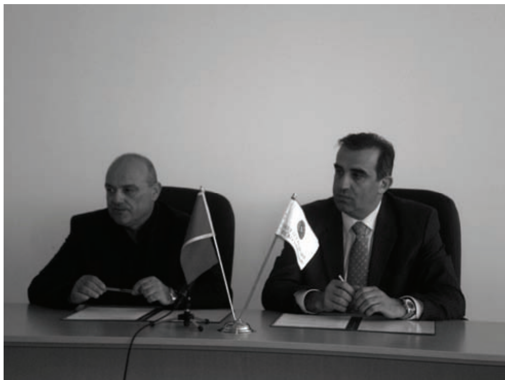
Kongres CSA podržali su COK i preko svojih organa MOK

This paper covers only the first part of the research, which has yet to be completed by obtaining the complementary feedback from pupils (they still lack the necessary knowledge for this level of training). Therefore, final considerations should be postponed and remain inconclusive at present.