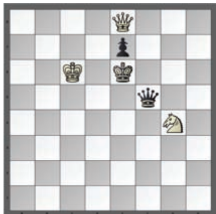
Slika 3. Nepoznat autor, s. a. (Andrić, 1985b)