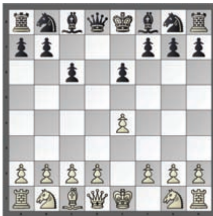
Slika 10. Pozicija posle 4. poteza crnog 1. e4 e6 2. Lb5 Ke7!! 3. Ld7! c6 4. Le8!! Ke8