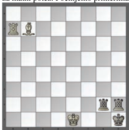
Slika 1. R. Mor, 1900. (Andrić, 1985b)

Najčešće se u rešenjima retraktora kriju rokada, promocija (vrlo često je u pitanju tzv. „minorna promocija“, koja podrazumeva da novonastala figura nije dama, već top, lovac ili skakač) i uzimanje u prolazu, što je posebno značajno jer se na taj način učenicima skreće pažnja na poteze koje najteže prihvataju i koji im zadaju najviše problema. Posebna pažnja obraća se na kraljeve i topove koji se nalaze na početnim položajima (skrivena rokada), figure na prvom i osmom redu (skrivena promocija), ili pešake na redovima od trećeg do šestog (skriven „an pasan“). Od njih se zahteva da sagledaju i mogućnost vraćanja tih poteza, ali i da ih predvide kao rešenje za matni potez. Počinjemo primerima sa rokadom.