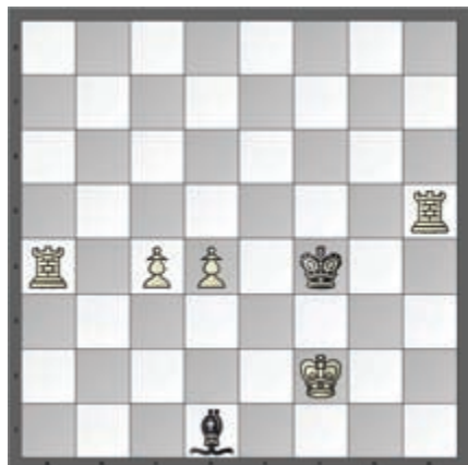
Slika 5. (vraćen potez: 1. c2-c4) (matni potez: 1. d4-d5#)