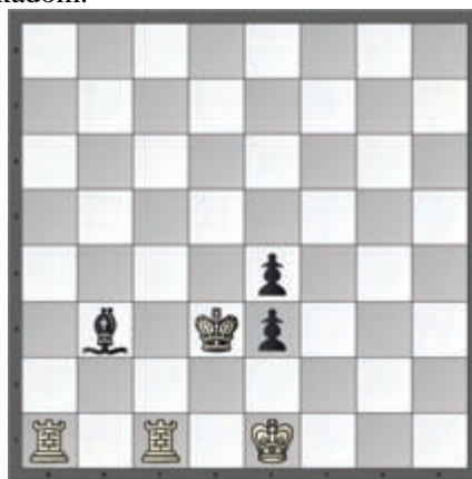
Slika 2. Nepoznat autor, s. a. (Andrić, 1985b)

Beli vraća potez 1. Ta1-a7, a zatim rokira na veliku stranu 1. 0-0-0#, koristeći motiv veživanja crnog topa po dijagonali a8-h1.