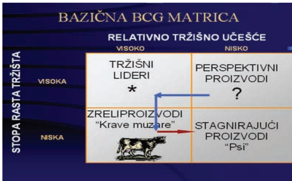
Shema 2. Put košarkaškog kluba „Beneton“ prikazan kroz „BCG“ matricu

Trećim petogodišnjim planom (od 1993. do 1997. god.) učinjen je pokušaj što dužeg zadržavanja u „poziciji zvezde“ ( Shema 2 ), uz adekvatno reagovanje na okruženje. Akcenat je stavljen na jačanje odnosa sa lokalnom zajednicom. Klub je nastavio da ostvaruje rezultate na takmičenjima domaćeg i evropskog nivoa. Ojačani su odnosi sa lokalnom zajednicom putem organizovanja besplatnih košarkaških kampova i finansiranjem školskih sportskih takmičenja.