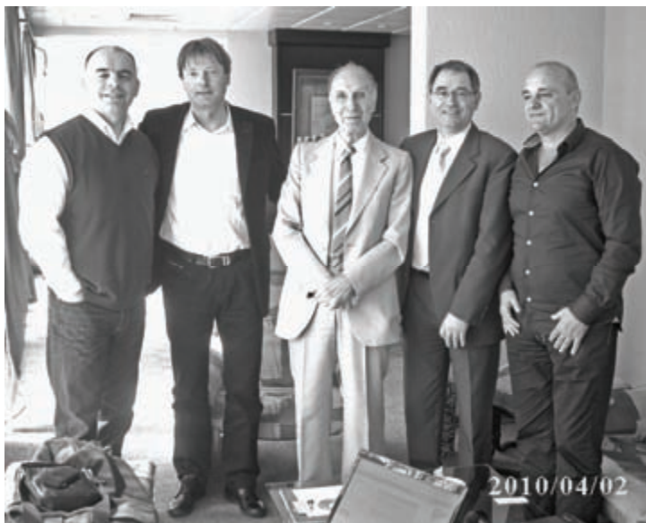
Regionalno povezivanje i saradnja naučnika

Key words: sagital disorders, the spinal column, cyfosa, lordosa.