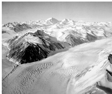
Slika 1. Planinski glečcer-Alpi

Način oblačenja i upotreba zaštitne opreme u saglasnosti su sa klasičnim skijanjem na velikim nadmorskim visinama. Neophodno je oblačiti svetliju i vodootpornu Ski-opremu: ski-rukavice, kapa i naočare (zatamnjenih stakala zbog refleksije svetlosti). Od osnovne ski-opreme koriste se skije (sa različitim vezovima), štapovi (zakrivljenog profila) ili „snow-board“ (daska za skijanje).