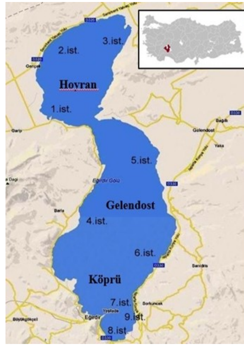
Şekil 1. Örnekleme noktaları

Fekal koliform analizinde gaz oluşumu gözlenen LST tüplerinden 10 mL EC buyyon içeren tüplere öze ile inoküle edilerek 48 \pm 2 (24+24) saat 45,5 \pm 0,2 °C de su banyosunda inkübe edilmiştir. Gaz oluşturan tüpler pozitif kabul edilmiştir.