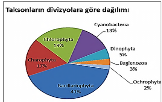
Şekil 4. Taksonlarının divizyolara göre dağılımı

diğer bölümlere göre takson ve birey sayısı bakımından daha varlıklı olduğu görülmüştür. Bacillariophyta'dan 43, Chlorophyta'dan 20, Charophyta'dan 18, Cyanobacteria'dan 13, Dinophyta'dan 5, Euglenozoa'dan 3, Ochrophyta'dan 2 olmak üzere toplam 104 takson saptanmıştır (Tablo 2.).