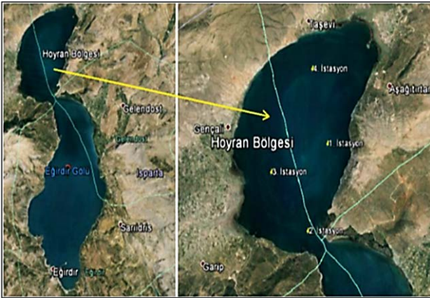
Şekil 1. Eğirdir Gölü-Hoyran Bölgesi örnekleme istasyonları

Eğirdir Gölü kuzey ve güney doğrultusunda iki havzaya ayrılmıştır. Kuzey havzaya Hoyran, güney havzaya ise Eğirdir Bölgesi denmektedir. Bu alanlar Hoyran veya Kemer boğazı denilen dar bir boğazla birbirinden ayrılır. Hoyran Bölgesi daha sığ olup, sazlık bölgeler havzada ve boğaz bölgesinde daha geniş alanları kapsar. Bu bölge de su kuşları için önemli alanlar bulunur. Kıyı kesimlerinde elma bahçeleri ve tarım alanları bulunmakta, bataklık alanlar ise daha çok gölün kuzeybatısında yer almaktadır [6].