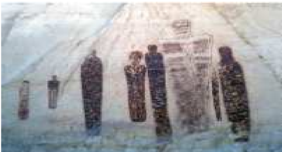
Figura 3: Pintura de Coletor-Caçador. Utah Oriental ( 5000a.C – 500 a.C) (SCHAAFSMA, 2013, p.5) 17 .

Por outro lado, a possibilidade da reificação já ter começado na pré-história pode parecer à primeira vista absurda. Dizer que a “forma mercadoria” já era um fenômeno de dominação social objetivo muitos anos antes do advento das narrativas míticas – que deram início ao processo chamado por Adorno e Horkheimer de “Esclarecimento” – pode soar arbitrário, para não dizer estranho. Mas se levarmos em consideração o caráter cíclico da própria história natural, que até hoje reproduz a violência e a selvageria da natureza no âmbito social e cultural e que, sem dúvida, não se resume à categoria marxista de reificação, então tal tese tem um potencial de verdade que precisa ser levado em conta. Se, como nos diz Adorno, os primeiros desenhos das cavernas são protestos contra o processo da reificação, cada vez mais consumado em nossa era de saturação reificadora de reprodutibilidade técnica e de unidimensionalização da consciência coletiva, então a arte rupestre já possui em seu interior uma espécie de proto-história da reprodução técnica, bem como uma cripto-expressão, que seria então a representação da vontade da consciência primitiva de pôr termo ao sofrimento e a dor, libertando a natureza interna e externa do homem de seu destino mítico, que como tal mostrou-se trágico ao longo da marcha civilizatória.