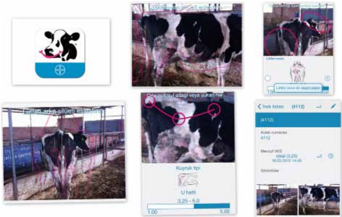
Figure 2. The assessment of a cow with BCS Cowditiion.