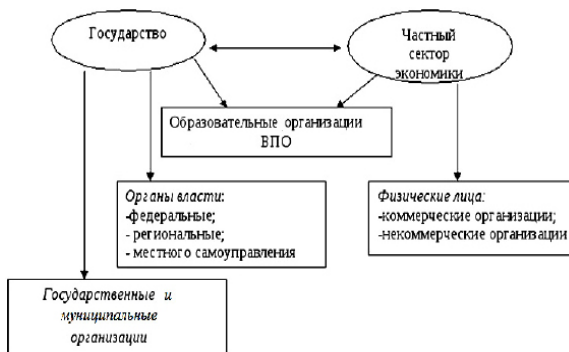
Рисунок 1. Стейкхолдеры государственно-частного партнерства в профессиональном образовании

Характерно, что если еще недавно бизнес-структуры ограничивались лишь спонсорством, то сегодня частный сектор увеличивает свою активность в сфере взаимодействия с вузами и расширяет свое присутствие в самом образовательном процессе (см. рис. 1).