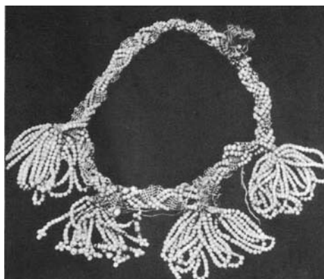
Рисунок 4. Ожерелье из кораллов [12, с. 119]

Бусам башкирские женщины уделяли особое внимание. Существовали бусы из коралловых нитей попеременно с монетами, из граненого стекла, шлифованных сердоликовых пластин, янтарные шейные ожерелья с крупными серебряными монетами. Традиция носить бусы уходит глубоко в древность. Так, бусы, найденные в пещерах Южного Урала и состоящие из бусин благородного серпантина, обработанных двухсторонним сверлением, были изготовлены, предположительно, в эпоху верхнего палеолита [3, с. 43]. Современные же аналоги отличаются большим разнообразием форм и пластики (рис. 4).