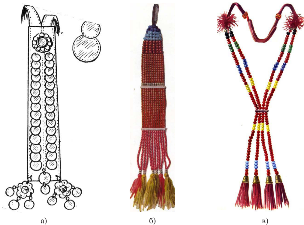
Рисунок 5. Накосные украшения башкир: а) тканевый накосник [12, с. 121], б) бисерные нити, плотно скрепленные в одну полосу [6, с. 58, 59], в) несколько бисерных нитей, перехваченных посередине полоской