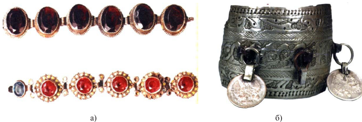
Рисунок 7. Башкирские браслеты: а) составной браслет со вставками, б) «звенящий» широкий, пластинчатый браслет [2, с. 351, 352]

Завершая краткий художественный обзор традиционных видов башкирских украшений, отметим, что основной их стилистической характеристикой является полихромность, фактурная и пластическая контрастность декора, выраженная, например, в сочетании объемного матового коралла и цветного бисера с блестящей поверхностью серебряных монет или в совмещении ажурности филигранных деталей с массивными штампованными пластинами. Необходимо отметить соразмерность украшений объемам одежды, пропорциональные соотношения которых близки