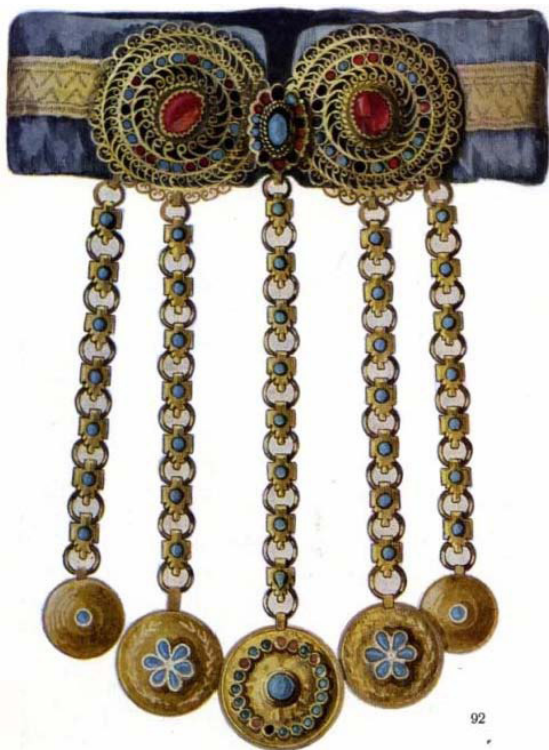
Рисунок 3. Женское шейное украшение. Филигрань. Серебро с позолотой. Бирюза [6, с. 72]

объемность подвески в виде круглых монолитных пластин придает ей пластическую выразительность, подчеркивая весомость и массивность нижней части, и ювелирную тонкость верхней. Воротник украшался позументной тесьмой в тон золотым завиткам филигранного узора.