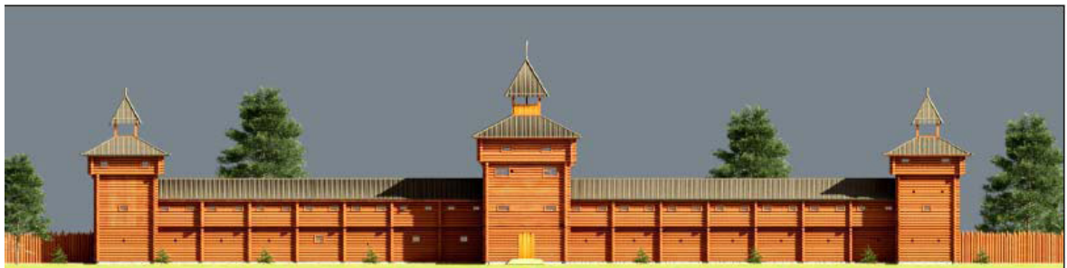
Рисунок 1. Эскиз входного узла музея-заповедника «Томская Писаница» в виде крепостной стены сибирского города

Первой и важнейшей экспозиционной зоной станет само здание нового Входного узла, задуманное в виде архитектурно-исторической реконструкции тарасной стены Томского города середины XVII века, основанной на материалах археологических исследований томского археолога М. П. Черной [10] (рис. 1).