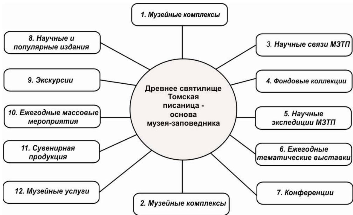
Рисунок 2. Схема: Культурно-исторический ландшафт комплексного историко-культурного и природного музея-заповедника «Томская Писаница»