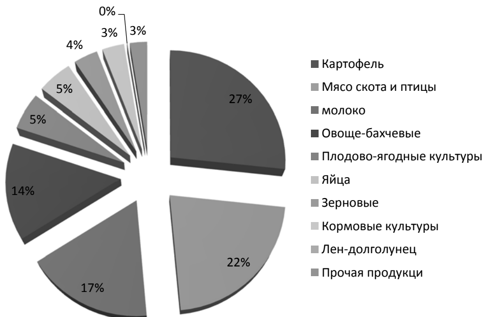
Рисунок 2 - Структура сельского хозяйства в 2013 году.

IV сфера – интегральная инфраструктура комплекса.