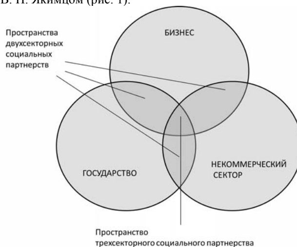
Рис. 1. Пространство трехсекторного социального партнерства

Наиболее удачное схематичное отображение межсекторного социального партнерства, которое отражает и специфику действий и взаимодействий в системе социальной защиты населения, представлено В. Н. Якимцом (рис. 1).