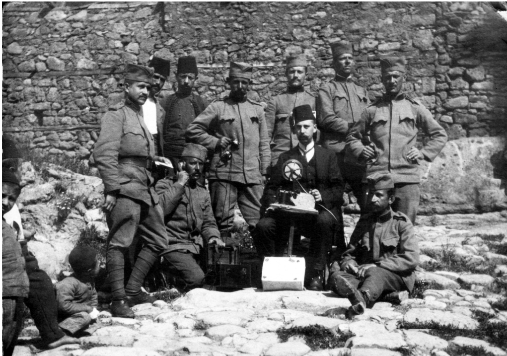
Сербські солдати у Кратово. 20 червня 1913 р.