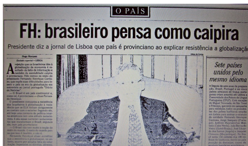
Figura 2 – Recorte de parte da notícia em O Globo (O País, 16/07/1996, p. 3)

A notícia de criação da CPLP é relevante e significativa. Em 16/07/1996, um dia antes da CPLP ser instituída, O Globo (O País, p. 3) repercute uma entrevista do presidente FHC ao jornal português Diário de Notícias . Ele afirma que o “brasileiro pensa como caipira” (Figura 2). Para o presidente, a “mentalidade caipira e provinciana” dos brasileiros “rejeita a globalização da economia”. E FHC tem uma explicação histórica para isso: “sem dúvida nenhuma, é uma variante da mentalidade crioula ”, ou seja, uma nítida referência aos negros na formação nacional. Essa entrevista foi publicada no mesmo dia na Folha (Brasil, p. 5): a “posição isolacionista seria uma variante da mentalidade crioula ” (Grifos nossos).