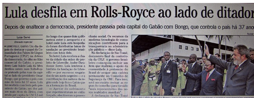
Figura 1 – Recorte de parte da notícia em O Globo (O País, 28/07/2004, p. 12)

Vejamos uma rápida ilustração: algumas notícias sobre os países africanos de língua portuguesa nos jornais Folha de S. Paulo e O Globo são resultado de viagens dos presidentes do Brasil até eles. Lula, por exemplo, visitou nações africanas e, muitas vezes, teve essa sua ação relacionada sempre com pobreza e ditadura, conforme a Figura 1. O porquê se recorre a essa associação? O que ela visibiliza? Quais acionamentos do dispositivo identitário estão aí?