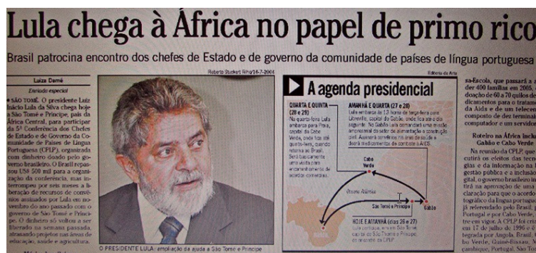
Figura 4 – Recorte de parte da notícia em O Globo ( O País , 26/07/2004, p. 8)

Nos três primeiros anos do Governo Lula a lógica dos jornais se mantém na relação aos países africanos e a CPLP. O desprestígio dessa comunidade é tanto que a Folha , em 12/07/2003 diz: “Lula propõe bloco da língua portuguesa”. O jornal publica falas que seriam do presidente e que são reveladoras: “A CPLP, talvez mais que nenhuma outra instância, mostra o quanto Portugal e Brasil podem realizar juntos. Afinal, não nos faltam o que poderiam chamar de vantagens comparativas – a língua, a cultura, a afinidade natural”. Em O Globo , os relatos são os mesmos, como na edição do dia 26/07/2004, conforme Figura 4.