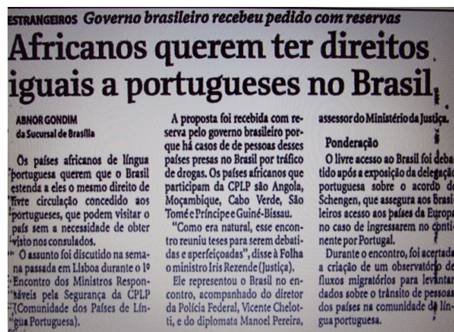
Figura 5 – Folha de S. Paulo (Cotidiano, 15/07/1997, p. 4)

concedido aos portugueses, que podem visitar o país sem a necessidade de obter visto nos consulados. (...) “O Governo brasileiro recebeu o pedido com reservas (...) porque há casos de pessoas desses países presas no Brasil por tráfico de drogas”. O perigo, o medo do outro é africano também aparece em edições e em O Globo .