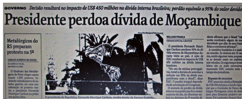
Figura 3 – Recorte de parte da notícia na Folha de S. Paulo (Brasil, 18/07/2000, p. 7)

Em 18/07/2000 a Folha (Brasil, p.7) traz: "Presidente perdoa dívida de Moçambique", conforme Figura 3. Ao discursar na reunião da CPLP, " FHC incorporou o papel de líder do bloco formado por sete países ". Diz o jornal: "De uma só vez, FHC mandou recados para dissidentes políticos de Angola, cobrou união do grupo para enfrentar os efeitos da globalização, estabeleceu prioridades para o desenvolvimento comum, distribuiu verbas para treinamento de pessoal e disponibilizou tecnologia (...) O discurso do presidente foi voltado principalmente para os 'primos pobres' africanos ". (Grifos nossos).