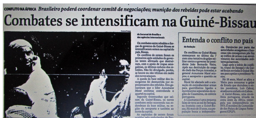
Figura 6 – Recorte de parte da notícia na Folha de S. Paulo (Mundo, 19/06/1998, p. 15)