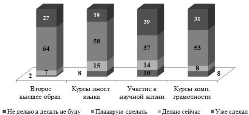
Рис. 3. Дальнейшие планы на будущее в зависимости от курса обучения, %

Так 64 % студентов планируют получить второе высшее образование, 58% - обучаться на курсах иностранного языка, при том, что 23% уже сделали или делают последнее. Такое желание обусловлено увеличивающимися требованиями работодателей к сотрудникам. Особенно востребованным является изучение иностранных языков и повышение уровня компьютерной грамотности.