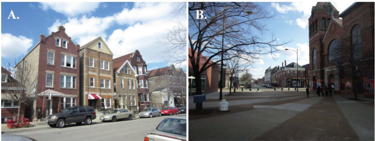
Figura 5. A. Mejoramiento de edificios promovido con recursos de TRP. B. El Zócalo en el Barrio de Pilsen.

rico, desde sus inicios fue multicultural por los diversos grupos étnicos que aquí se asentaron. Ahora ocupado por mexicoamericanos, se enriquece en colores con la cultura y el espíritu, de estos nuevos habitantes que lo están revitalizando. La proximidad que tiene el barrio con el campo de la universidad de Illinois, la proximidad con el Río de Chicago y algunas fábricas que aun están en operación, lo han convertido en un barrio asediado para muchos, entre ellos los mexicanos. La comunidad mexicana que vive en el barrio tiene retos importantes que enfrentar, uno de ellos es el fenómeno de gentrification , que desplaza a los habitantes de bajos recursos para dar lugar a los de altos recursos, debido a su excelente ubicación en la ciudad. Este fenómeno asecha al barrio desde hace más de diez años y sigue creciendo.