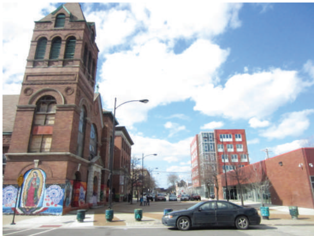
Figura 6. El Zócalo, oficinas del TRP y al fondo casa del estudiante.