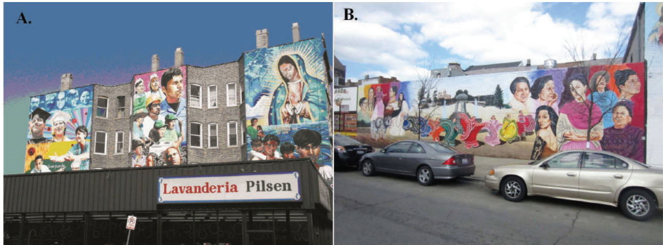
Figura 2. A. Murales en el Barrio de Pilsen. B. Murales en el Barrio de Pilsen.

canos. Muchos de los motivos de estos murales son alusivos a las luchas por los derechos sociales y raciales en esta ciudad. Son mensajes de las luchas y esfuerzos, que han soportado para sobrevivir en este país. (Figuras 2a y b)