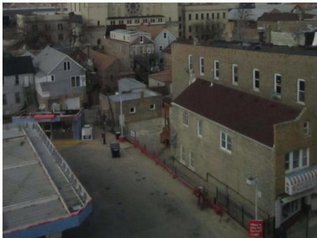
Figura 1 El Barrio de Pilsen.

borde de uno de los ramales del Río de Chicago. Estas circunstancias lo mantienen relativamente aislado dentro de la ciudad, pero ahora como un distrito histórico. (Murtagh 1997, p. 103).