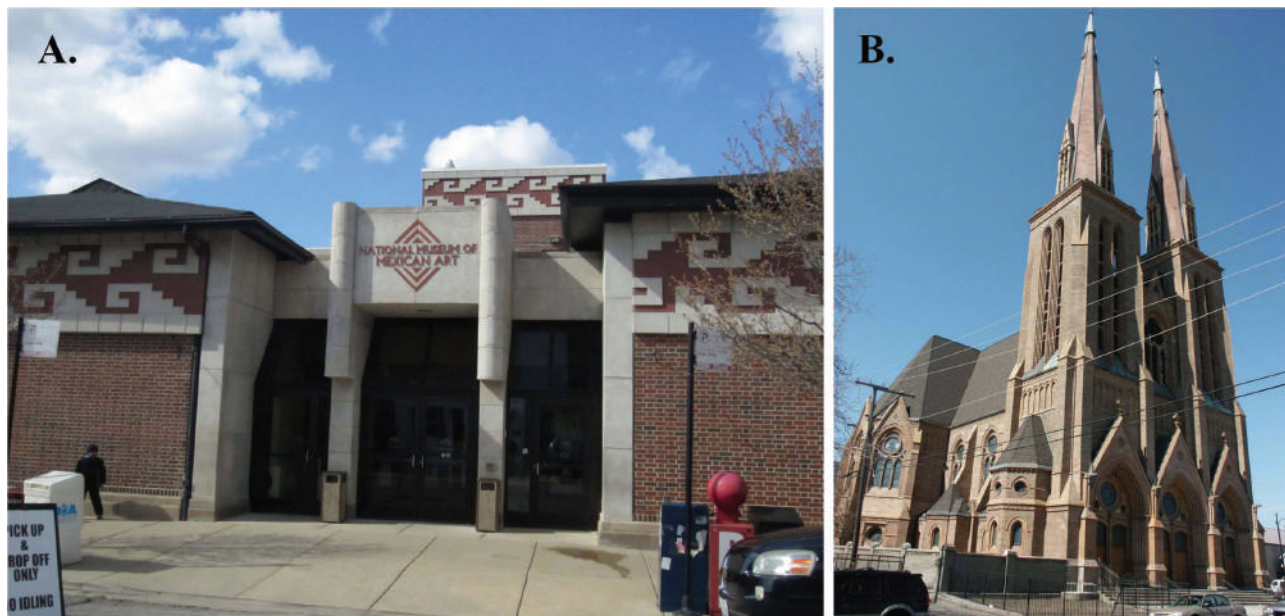
Figura 3.A. Entrada al Museo Nacional de arte Mexicano en Pilsen. B. Iglesia de San Paulo en el Barrio de Pilsen.

La apropiación del espacio del parque, no sólo ha sido física sino también social. Se aprovechó la gran cantidad de mexicanos en ese lugar y con ello generar este importante espacio cultural. (Figuras 3a y b)