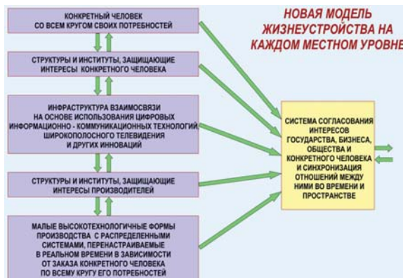
Рис. 2. Новая модель жизнеустройства на каждом местном уровне

О важности формирования новой модели отношений на местном уровне совсем недавно заявил бывший премьер-министр, академик РАН Евгений Примаков, выступая на заседании «Меркурий-клу-