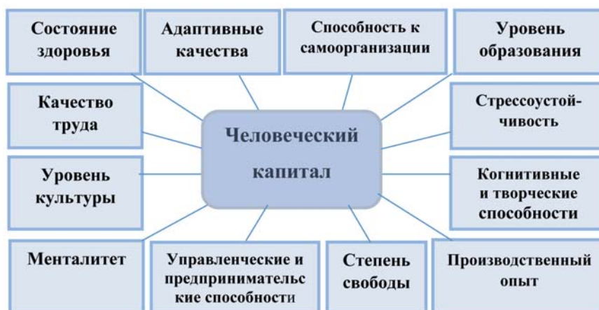
Рис. 1. Структурные элементы человеческого капитала

Человеческий капитал – сложный синтетический фактор, который агрегирует комплекс социально-экономических, психологических и иных параметров человеческих ресурсов. Структура человеческого капитала представлена на рис. 1.