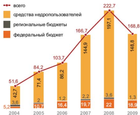
Рис. 3. Структура затрат на воспроизводство минерально-сырьевой базы Российской Федерации в 2004–2009 гг., млрд. руб.

Исходя из вышеизложенного, для обеспечения национальной экономики МСР необходимы инвестиции. Однако, инвестиции в воспроизводство МСБ в 2009 г. составили 168,8 млрд руб., сократившись по сравнению с 2008 г. почти на четверть; близкий уровень затрат фиксировался в 2007 г. (рис. 3) (О состоянии и использовании ..., 2010).