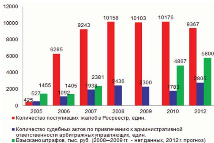
Рис. 2. Динамика привлечения к административной ответственности арбитражных управляющих в 2005–2012 гг.

На рис. 2 представлена динамика привлечения к административной ответственности арбитражных управляющих в 2005–2012 гг. По данным, приведенным на рис. 2, можно сделать вывод, что увеличение численности арбитражных управляющих – членов СРО АУ не обеспечивается надлежащим и эффективным контролем их деятельности со стороны СРО АУ. Несмотря на требования, предъявляемые к арбитражным управляющим, профессионализм и качество их работы, в настоящее время, остается еще невысоким. Так, за 2006–2008 гг. общее число жалоб на действия арбитражных управляющих по фактам их неправомерных действий при банкротстве, поступивших на рассмотрение в орган по контролю (надзору) (Росреестр), резко увеличивается. За 2007 г. число обращений выросло в 2 раза, а количество возбужденных административных производств в отношении арбитражных управляющих – более чем в 3 раза. За 2008 г. число жалоб увеличилось на 15 процентов [4, 6; 72–73].