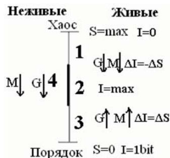
Рис. 2. Энтропия, информация и стоимость объектов в неживых, биологических и социальных системах. Стрелки показывают направление G-процессов и возрастания стоимости объектов M

На рис. 2 показано соотношение энтропии и информации в неживых, биосферных и социальных системах.