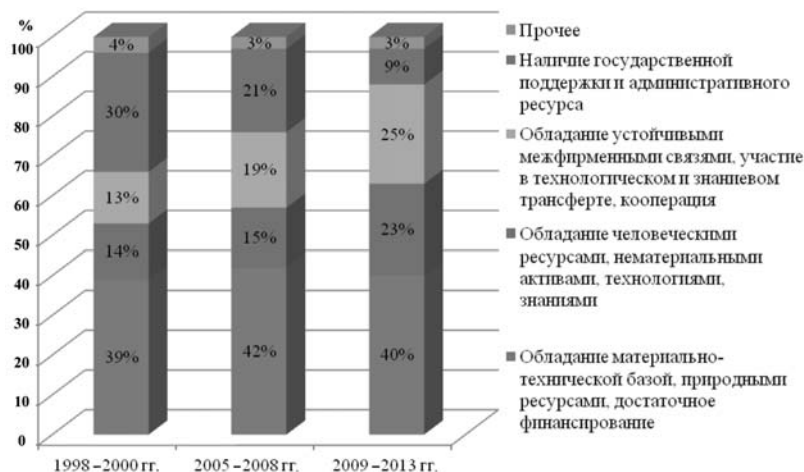
Рис. 1. Структура факторов, определяющих конкурентоспособное и интенсивное развитие промышленных предприятий в Российской Федерации за период от 1998 года по 2013 год 1

спечивают конкурентоспособное, интенсивное развитие инновационных промышленных предприятий, понимаемое нами как устойчивое развитие: