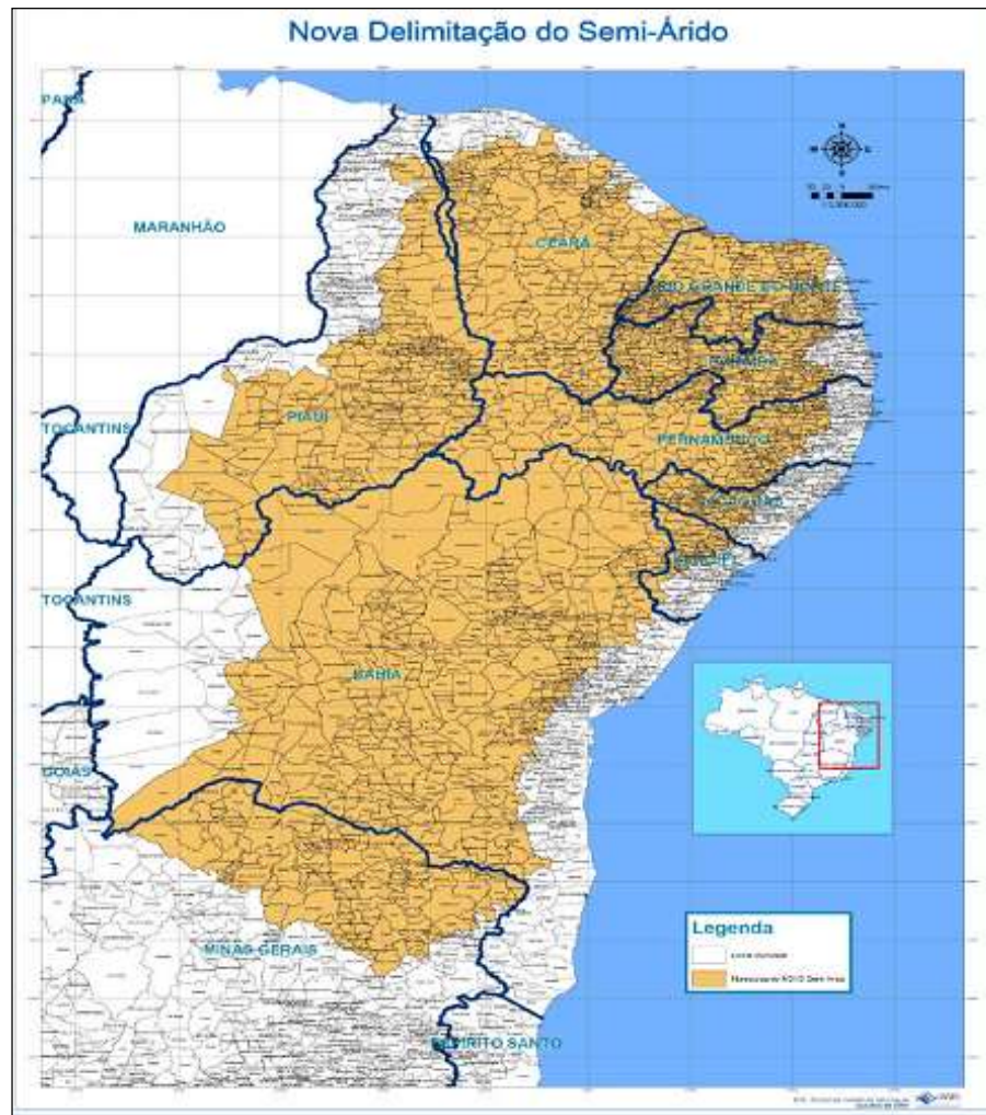
Figura 1 – Delimitação do Semiárido Brasileiro.

Os municípios que integram o Semiárido participam na maior parcela do Fundo Constitucional de Financiamento do Nordeste (FNE), que deve ter pelo menos 50% de seus recursos destinados a atividades produtivas na região. Fazem parte do Semiárido os municípios que possuem pelo menos um dos seguintes critérios: