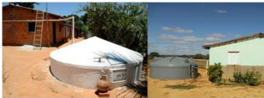
Figura 3 – Cisternas para captação de água de chuva para consumo humano: de placas de concreto à esquerda e de polietileno à direita.