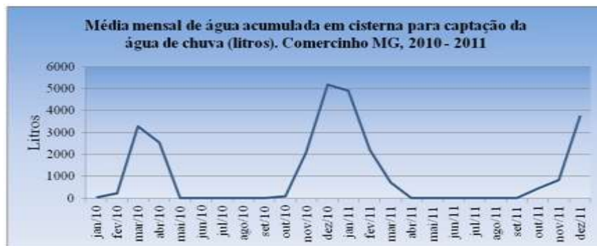
Gráfico 1 - Simulação da média mensal de água armazenada em cisternas para captação da água de chuva para consumo humano - consumo de 100 litros diários durante todo o ano. Comercinho, Minas Gerais, 2010-2011.

(1) Número de dias em que a família teve satisfeita sua demanda de 100 litros diários.