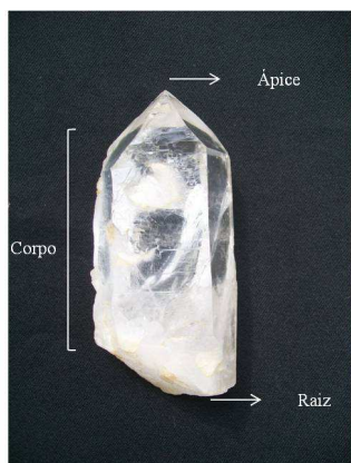
Figura 2. Terminologia proposta para os cristais de quartzo.

Para organizar e estudar as coleções a principal abordagem é a Análise Tecnológica, que permite restituir as peças em seus lugares no seio de uma cadeia operatória (MAUSS, 1947; MAGET, 1953; LEROI-GOURHAN, 1966; INIZAN et al. , 1995; PELEGRIN, 1995, 2004, 2005; etc.), utilizando a classificação morfo-tecnológica, a partir de um nível de hierarquização para cada elemento, o que permite julgar a homogeneidade técnica da coleção (RODET, 2006). Para isto, é necessário cruzar os dados observados sobre os suportes dos utensílios, sobre os núcleos e sobre os brutos de debitage, o que permitirá isolar as grandes tendências das séries estudadas (TIXIER ET AL, 1980; PERLÈS, 1991; GENESTE, 1991; BOEDA, 2001; PELEGRIN, 1995; 2005).