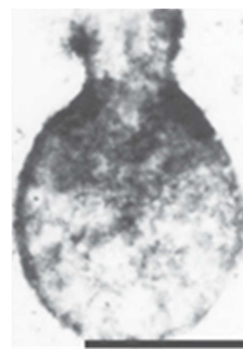
Figura 1. VSM da Formação Urucum, Jacadigo, Mato Grosso do Sul. Imagem retirada de Zaine (1991). Escala: 50 micrômetros.

topo fosfatizado da Formação Bocaina que na Formação Urucum, indicando uma possível maior oferta de nutrientes neste período (MORAIS et al. , 2012).