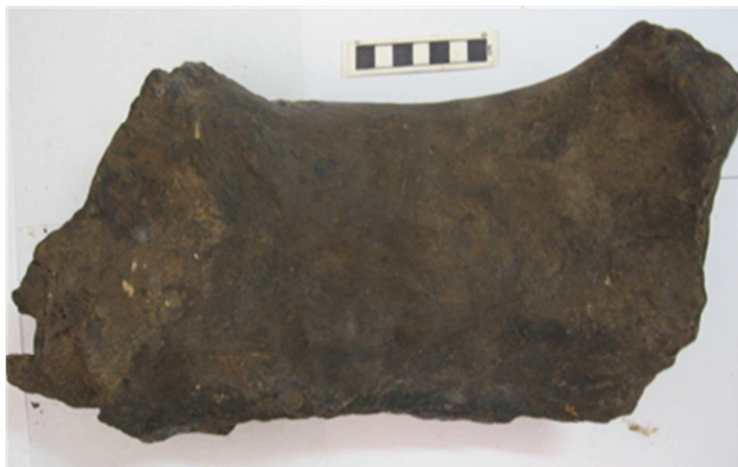
Figura 4. Parte mesial de osso de preguiça terrícola resgatado na Gruta das Fadas, Mato Grosso do Sul.