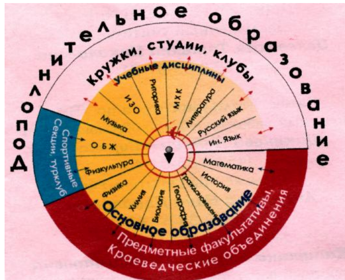
Рис. 1. Модель интеграции основного и дополнительного образования в школе

Здесь каждый элемент системы направлен на развитие медиакомпетентности учащихся, и базируется не только на теоретической основе, но и подкреплен богатейшим фондом проблемного иллюстративного материала, подготовленного как студентами вуза, так и учащимися школы.