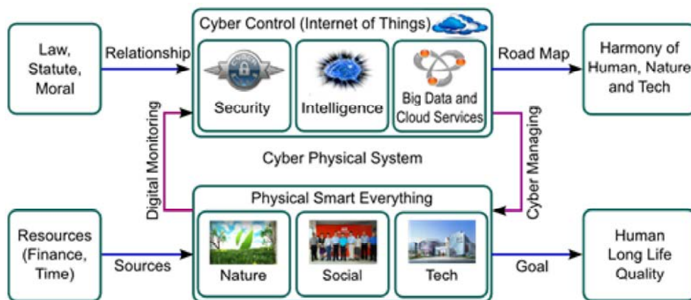
Рис. 1. Киберфизическая система управления неприродными процессами

Рыночно-привлекательные глобальные проекты сегодня выполняются под эгидой объединения физического и виртуального пространства в единое целое. Киберфизическое пространство (Cyber Physical Space)