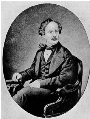
Рис. 1. Джеймс Стнислав Белл (1797–1858 гг.)

В 1836 г. в район Гагр прибыл еще один британский агент – корреспондент газеты «Morning Chronicle» Лонгворт [28]. Методы его деятельности в точности повторяли методы Белла. После этого оба агента, согласно агентурным данным, двинулись по побережью и встретились у Геленджика.