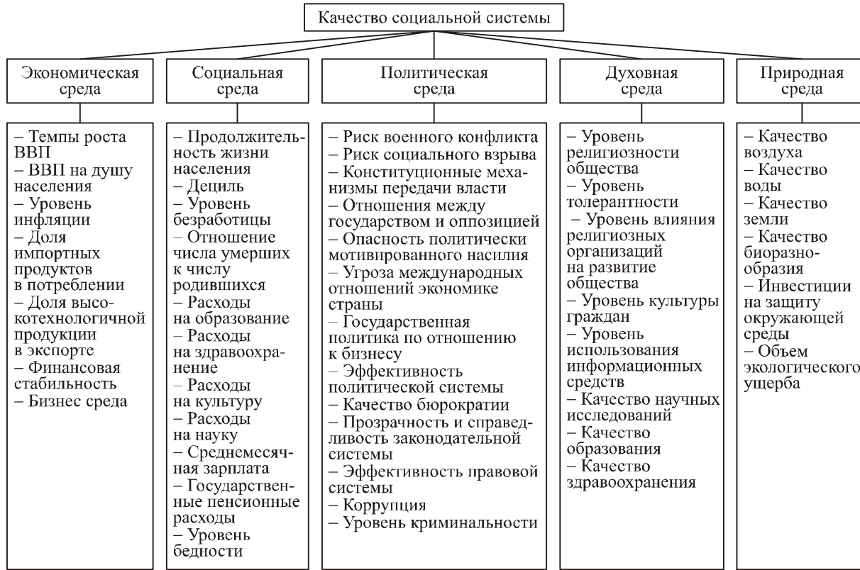
Рис. 1. Система показателей подсистемы социальной системы