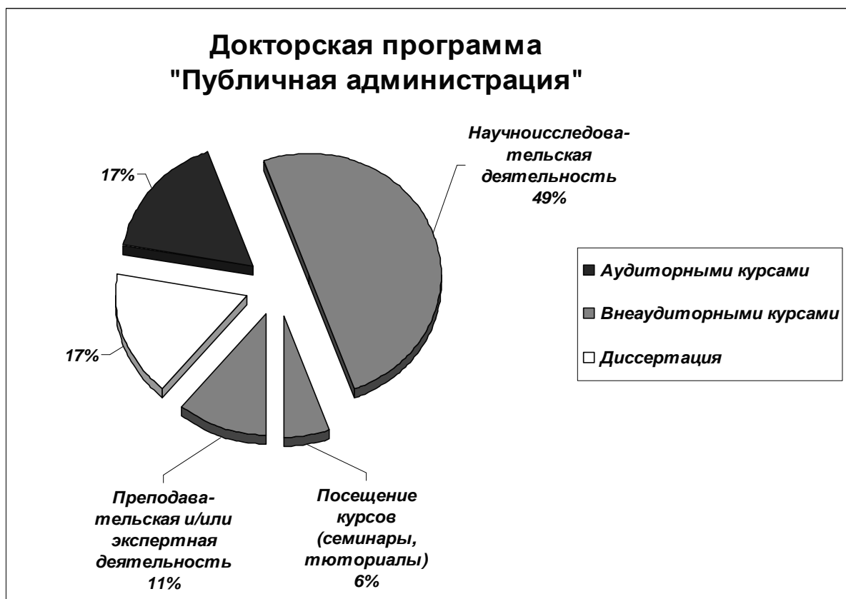
Рис. 3. Докторская программа «Публичная администрация»

Процентное соотношение показывает, что данной программой предусматривается проведение внеаудиторной учебной формы – научно-исследовательская деятельность. Очень малая часть отведена на другие две формы – посещение курсов (семинаров, тьюториалов) и преподавательская и (или) экспертная деятельность.