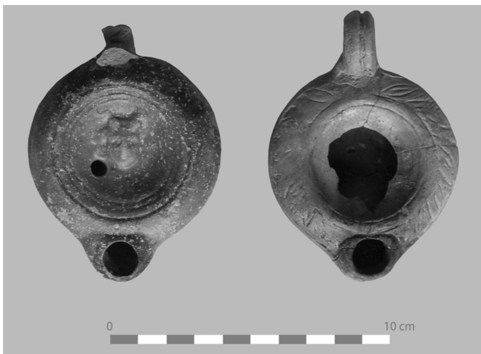
Рис. 3. Глиняные светильники II-III вв. н.э. из помещения винодельни.