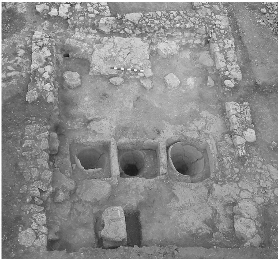
Рис. 2. Помещение винодельни на земельном наделе 340 (вид сверху).