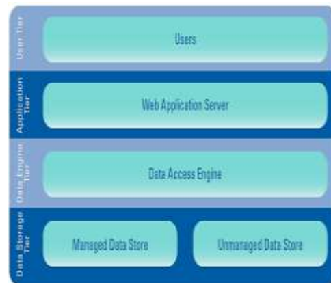
Gambar 2 menunjukkan berbagai tingkatan arsitektur ini.

Arsitektur aplikasi terdistribusi benar-benar dimungkinkan oleh dua hal. Pertama, Web browser yang muncul sebagai tools di setiap desktop. Kedua, kelas perangkat lunak yang dikenal sebagai aplikasi server terungkap bahwa memungkinkan fungsionalitas aplikasi akan dikirimkan ke desktop melalui Web browser. Hilanglah biaya distribusi dan pemeliharaan bagi klien (web browser) baik terinstal dalam sistem operasi, atau paling tidak tersedia bebas untuk didownload dan diinstal dengan mudah. Masalah skalabilitas itu hilang karena lingkungan aplikasi server terpisah dalam berbagai komponen yang menangani permintaan pengguna sehingga mereka dapat ditingkatkan sesuai kebutuhan.