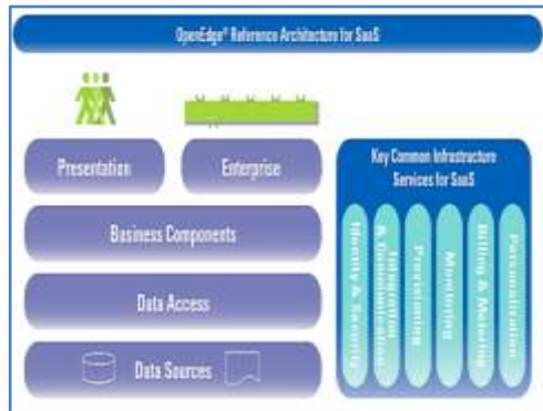
Gambar 4. SaaS Architecture

tambahan yang memperhitungkan fungsi tambahan penawaran SaaS yang matang yang mungkin diperlukantelah diidentifikasi. Masalah-masalah administrasi dan pemantauan disajikan sebagai komponen yang beroperasi di seluruh tingkatan. Komponen-komponen ini sangat penting untuk operasi yang efisien dari bisnis SaaS.