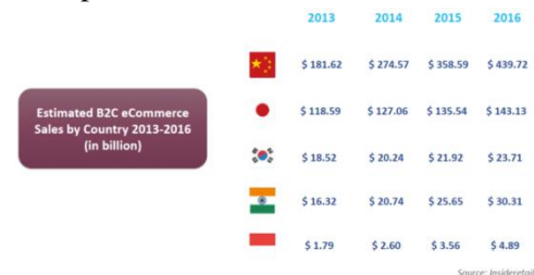
Gambar 1. Estimasi penjualan e-commerce wilayah Asia-Pasific

Lembaga riset ICD memperkirakan bahwa potensi e-commerce di Indonesia akan tumbuh 42% pada tahun 2012-2015, dan merupakan salah satu negara dengan pertumbuhan e-commerce terbesar untuk wilayah Asia-Pasific. Gambar dibawah ini merupakan estimasi penjualan e-commerce untuk wilayah Asia-pasific.