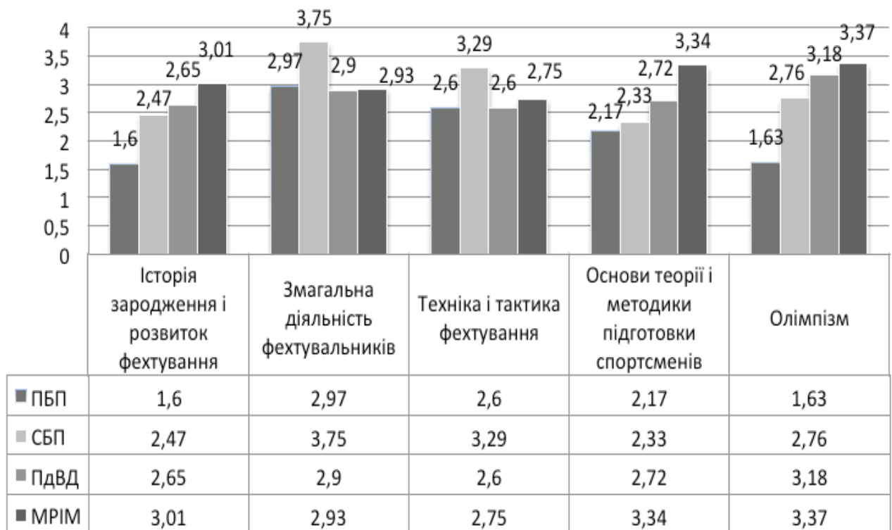
Рис. 1. Освіченість фехтувальників на різних етапах багаторічної підготовки

Зміст питань анкети «А» передбачав освіченість спортсменів щодо базових відомостей про виникнення фехтування та його сучасний стан, термінології, техніко-тактичних дій та правил змагань; виникнення Олімпійських ігор у Стародавній Греції та їх відродження у 19 ст., поняття, символи, церемонії та відомі постаті, пов'язані з сучасним олімпійським рухом, види спорту у програмі Ігор Олімпіад.