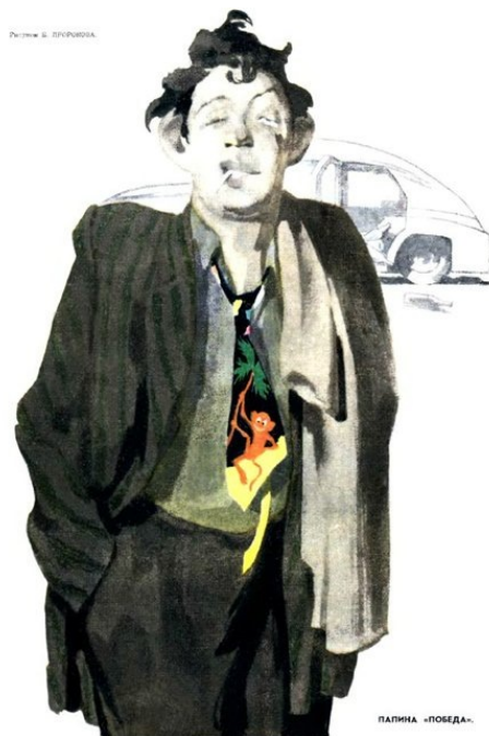
Рис. 5. Костюм «с искрой», галстук «с обезьянкой» – неперенные атрибуты молодого бездельника и шалопа из «приличной» семьи [9]

Бесспорно, феномен стилижничества был куда более глубоким, чем его представляла советская власть. Данная субкультура явилась своеобразным стихийным протестом против навязываемых стереотипов поведения, а также против единообразия в одежде, музыке и в стиле жизни. Стилижничество не создало полноценных самостоятельных образцов молодежной культуры. Однако мировоззрение стилиг оказало немалое влияние