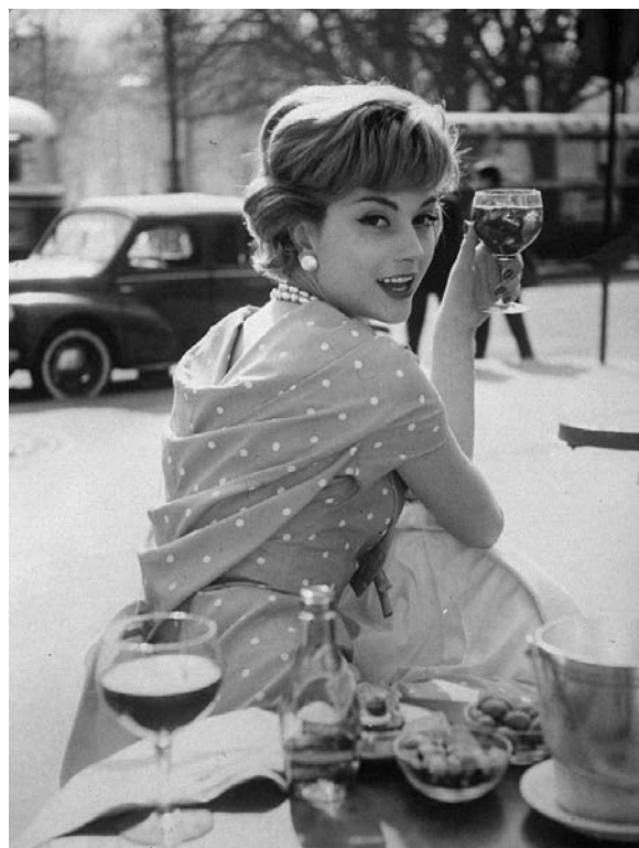
Рис. 2. Мари-Элен Арно – французская актриса, модель, модельер, фотография, опубликованная в журнале «Лайф», автор – Лумис Дин, 1957 г. [5]