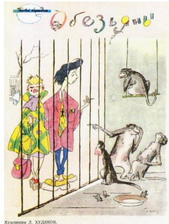
Рис. 3–4. Главный сатирический журнал страны «Крокодил» представлял стилиг в виде крайне омерзительных персонажей: поганок, обезьян [7, 8]