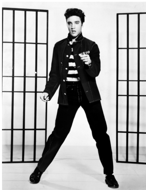
Рис. 6. Элвис Пресли. Кадр из кинофильма “Jailhouse Rock” [14]