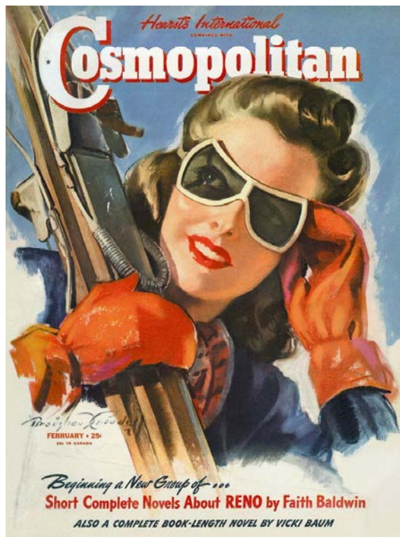
Рис. 1. Обложка журнала «Cosmopolitan». 1941. № 2