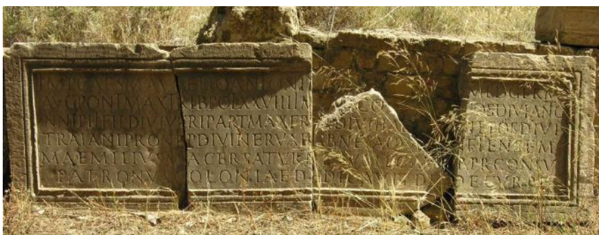
Photographie 3: Inscription retrouvée près de la fontaine du forum

Une inscription (C.I.L., VIII, n° 17869) a été retrouvée près de cette fontaine nous faisant connaître que l'eau fut amenée à la fontaine, vers 172, sous le commandement du légat Aemilius Macer Saturninus (Photographie 3).