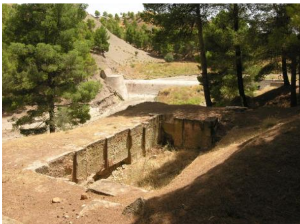
Photographie 1 : Bassin de décantation d'Ain-Morri