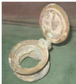
Photographie 6: Soupape en plomb