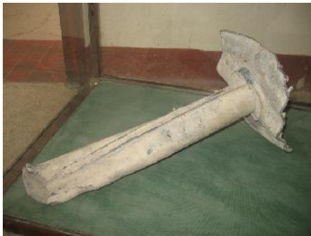
Photographie 5 : Conduite d'eau en plomb