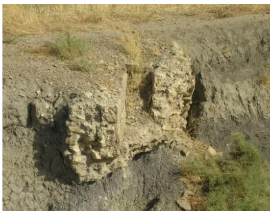
Photographie 2 : Vestige du canal de l'aqueduc d'Ain-Morri