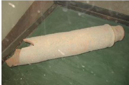
Photographie 4 : Conduite d'eau en terre cuite

La circulation de l'eau était réglée par des valves, des soupapes, contrôlée par des vannes, à l'extérieur des monuments. A l'intérieur des salles l'eau était maîtrisée et par des robinets près des bassins (photographie 6).