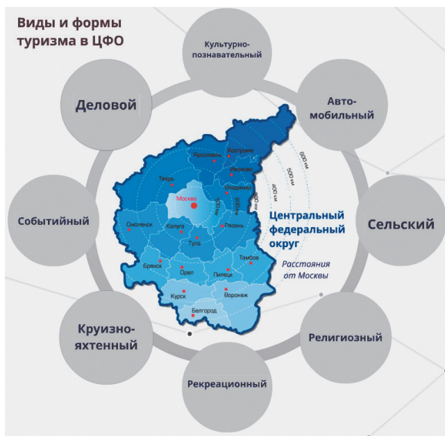
Рис. 1 – Наиболее перспективные для развития виды и формы туризма в Центральном федеральном округе

ЦФО представляет собой территорию комплексного развития туризма, так как здесь представлены практически все основные виды туризма, по большинству из которых он занимает лидирующие позиции в стране. Согласно Стратегии развития туризма в Российской Федерации, ЦФО «представляет собой центр культурно-познавательного и делового туризма страны. Ряд субъектов Российской Федерации, входящих в состав округа, располагает широкими возможностями для развития сельского и экологического туризма». Также наиболее перспективными для развития в регионах округа выступают паломнический, событийный, круизный и яхтенный, активный виды туризма (рис. 1).